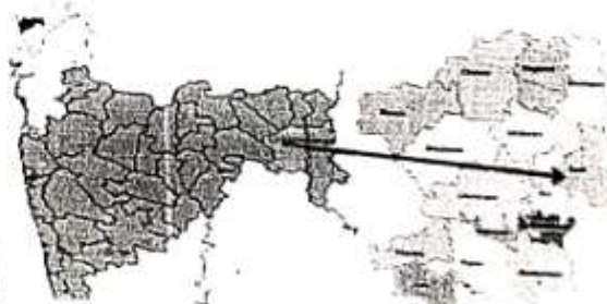
Fig. 1. Map of Maharashtra showing Chandrapur District & Saoli tahsil

the chief bee foraging plants, uni and multifloral honeys and areas suitable for bee-keeping industry in this area. Further, study of this nature would also highlight the geographical source of the honey.